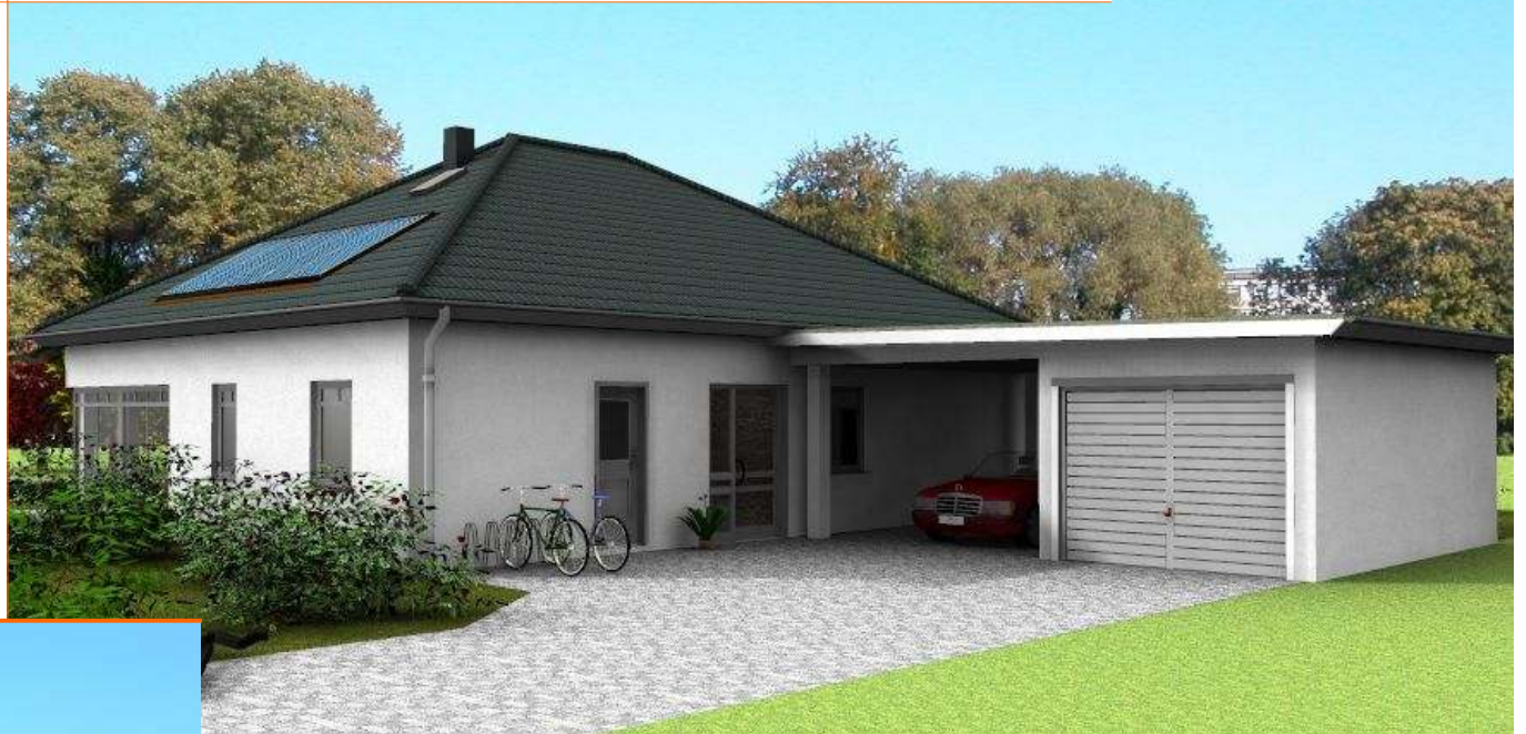
Ansicht der Eingangsseite (Garage und Carport stellen Mehrleistungen dar)

Wohnfläche 112m 2 +50m 2 Ausbau Außenmaße ca. 12,85m x10,35m